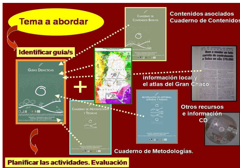
Gráfico 2: Componentes del Maletín Didáctico y estrategia de utilización

En el siguiente gráfico se presentan sus componentes y la manera en que recomendada para trabajar con ellos: