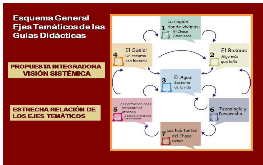
Gráfico 3: Ejes Temáticos

Como primera instancia para iniciar el trabajo con el Maletín es necesario definir el tema a desarrollar, luego, en función al mismo identificar en el Cuaderno de Guías Didácticas, la guía ó guías con las cuales se podrá trabajar el tema. Las guías Didácticas fueron pensadas como una “Hoja de Ruta”, como un camino donde encontrar diferentes alternativas que permitan abordar los contenidos según los destinatarios, con la posibilidad de introducir variaciones y/o cambios. Para poder abordar la compleja situación ambiental del Chaco se organizaron siete ejes que se complementan entre sí y presentan múltiples interrelaciones, como se puede observar en el siguiente gráfico: