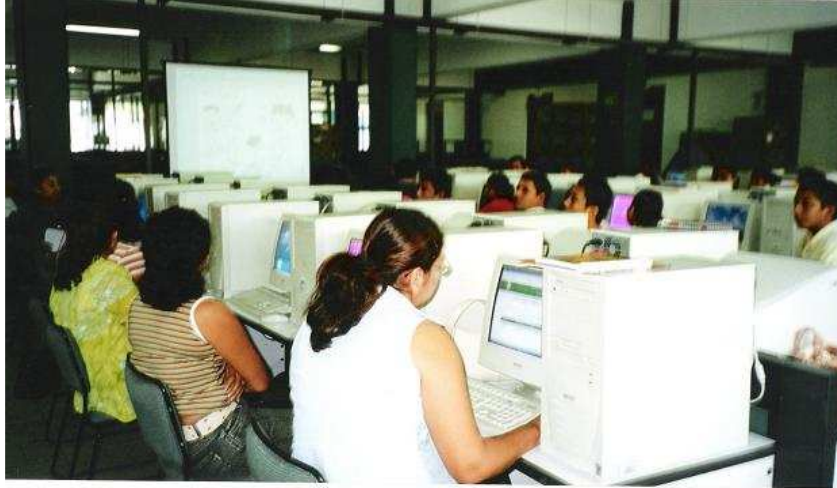
*Sesión de trabajo en el centro de cómputo de Tutorías SEAD DACEA

una tutoría presencial, pero no es obligatoria. Los medios de comunicación elegidos son básicamente el correo electrónico, el chat y el teléfono. El 50% de los tutorados intercambian mensajes de texto con el tutor cuando requieren algún tipo de ayuda.