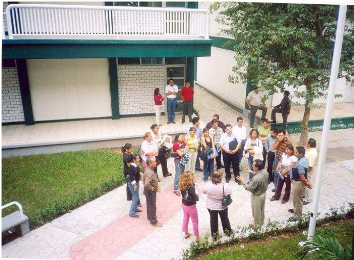
* Centro de Tutorías SEAD DACEA

Alumnos del grupo previo a la primera asesoría presencial, en una charla informal con el Director de la División, en la entrada del Centro de Investigación y tutorías