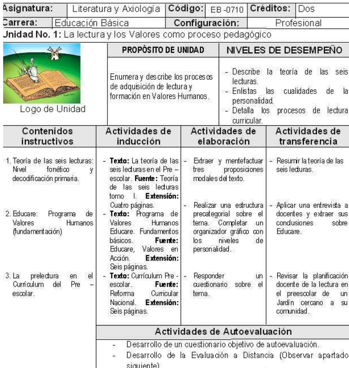
Cuadro No. 8: Matriz de actividades de instrucción.

Para poder organizar este tipo de actividades, el diseño instruccional nos brinda herramientas muy viables como la matriz de actividades de instrucción: Un ejemplo: